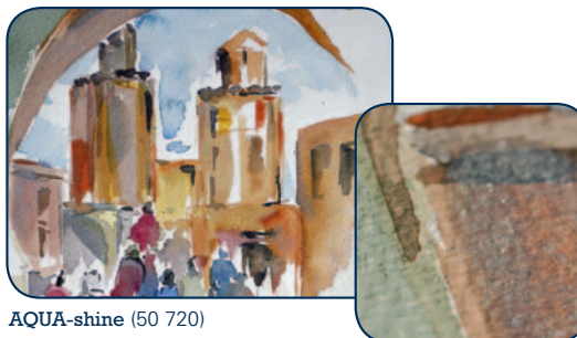
AQUA-shine (50 720)

AQUA-shine (50 720) pour des effets nacrés. Appliquer AQUA-shine pur ou mélangé à de l'aquarelle sur des couleurs déjà sèches. La dilution réduit les effets nacrés. Les parties ainsi nacrées ou brillantes deviennent imperméables. Ne pas mélanger le médium et la couleur dans un godet. Secouer avant utilisation.