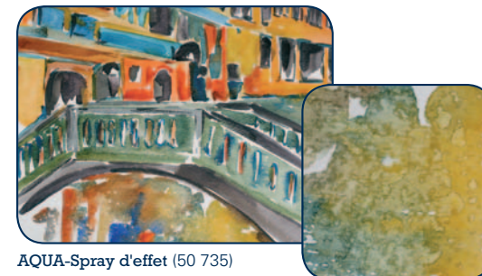
AQUA-Spray d'effet (50 735)

AQUA Spray d'effet (50 735) pour la création d'effets aléatoires sur des aquarelles. Vaporiser directement sur les couleurs dès leur dépose ou en cours de séchage. Distance d'utilisation: environ 20-30 cm. Aucun effet sur des surfaces trop absorbantes. Pour la réalisation de réserves utiliser le film de masquage.