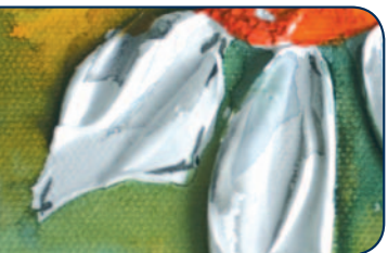
AQUA-pâte à modeler fine (50 706)

AQUA-pâte à modeler, fine (50 706) finition lisse et aquarellable et grossière (50 707) finition granuleuse et aquarellable. Permettent de réaliser des aquarelles en trois dimensions. De nouveaux effets de structure pour l'aquarelle. A appliquer sur le support à la spatule ou au couteau. Attendre un séchage complet avant de peindre à l'aquarelle. Peut être teinté avec les couleurs d'aquarelles en tube ou la peinture acrylique.