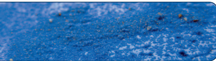
AQUA-collage (50 715)

AQUA-collage (50 715) base pour des collages; améliore l'adhérence du matériau de collage. A appliquer sur le support, pur (incolore) ou mélangé à de l'aquarelle et enfoncer les incrustations choisies (textiles, papier de soie, sable, pigments etc.) dans le médium encore humide. Reste soluble. Le mélange AQUA-collage et AQUA-fix devient imperméable et aquarellable. Ne pas mélanger le médium et la couleur dans un godet.