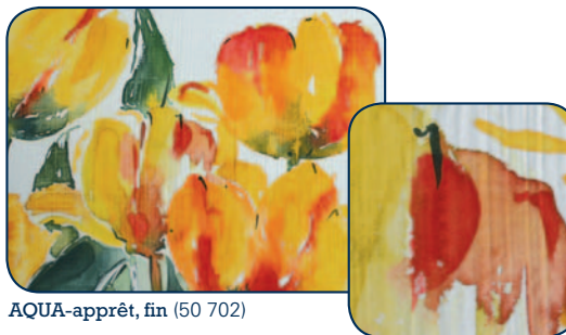
AQUA-apprêt, fin (50 702)

AQUA-apprêt, fin à rendu de surface lisse (50 702) ou AQUA-apprêt, rugueux à rendu de surface granuleux (50 703) sont utilisables sur de nombreux types de supports comme toile en lin, carton entoilé, bois etc. Peut être teinté par ajout d'aquarelle. Application d' AQUA-apprêt, fin au moins en 3 couches finement sur le support désiré à l'aide d'un pinceau ou d'un rouleau. AQUA-apprêt, rugueux à appliquer à la spatule ou au couteau. Aquareller après séchage.