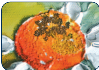
AQUA-pâte à modeler gross. (50 707)

AQUA-collage (50 715) base pour des collages; améliore l'adhérence du matériau de collage. A appliquer sur le support, pur (incolore) ou mélangé à de l'aquarelle et enfoncer les incrustations choisies (textiles, papier de soie, sable, pigments etc.) dans le médium encore humide. Reste soluble. Le mélange AQUA-collage et AQUA-fix devient imperméable et aquarellable. Ne pas mélanger le médium et la couleur dans un godet.